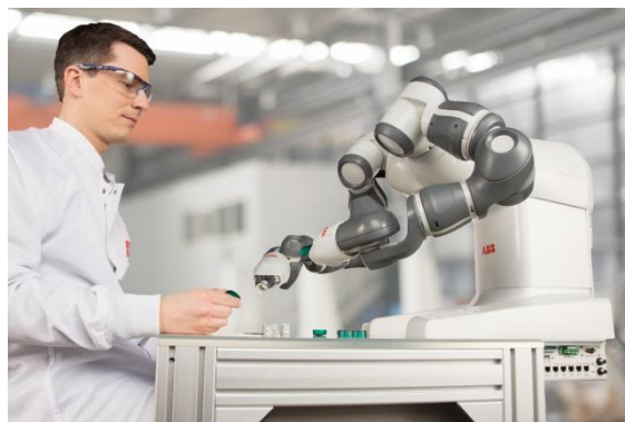
图 2 双臂协作机器人 YuMi

ABB 公司也有一款双臂协作型机器人，名叫 YuMi。作为一款人性化设计的双臂机器人，YuMi 使小件装配等自动化作业进入一个全新时代。工人和机器人可以和谐共处，共同完成同一个任务如图 2 所示。YuMi 在英文中是“你和我”协同工作的简称。这样的协作系统让机器人完成制造任务中那些繁琐的重复动作，而让专业人员专注于核心需求。