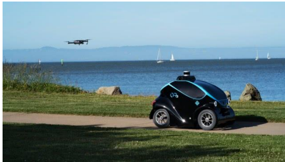
图4 地空协同安保机器人

无人机和地面移动机器人配合，可以扩展机器人对环境感知的能力，提高机器人工作效率，见图4。