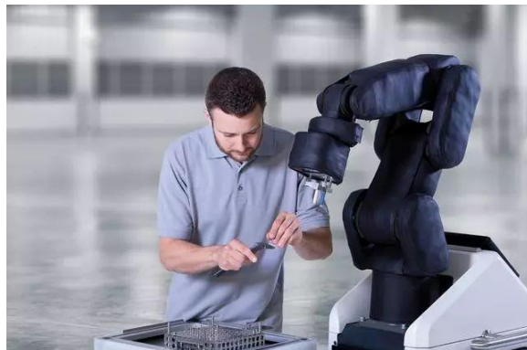
图 1 协作机器人 APAS

接触产生的非常规力，并给控制器提供一个即时反馈。同时，机器人还有安全距离保护，当检测到人靠得太近时，也会自动降低运行速度；在人离开该区域后，机器人会自动恢复正常速度，相当于隐形的防护网。